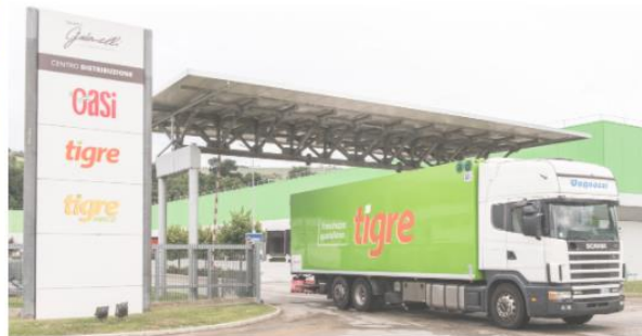
CE.DI. GENERI VARI